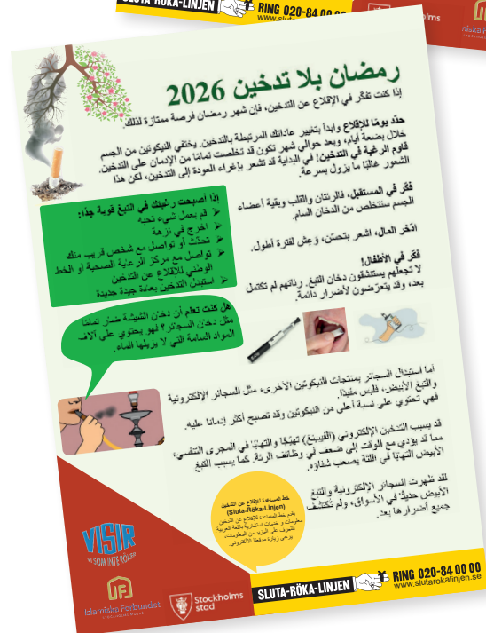
Folder som delas ut under Ramadanmånaden.

Vi vet att rökningen har minskat även bland utrikes födda med det finns ingen undersökning bara bland muslimer. I Stockholm kan emellertid konstateras att det nu inte finns några fimpar på marken vid moskén. Men fortfarande finns det de som röker.