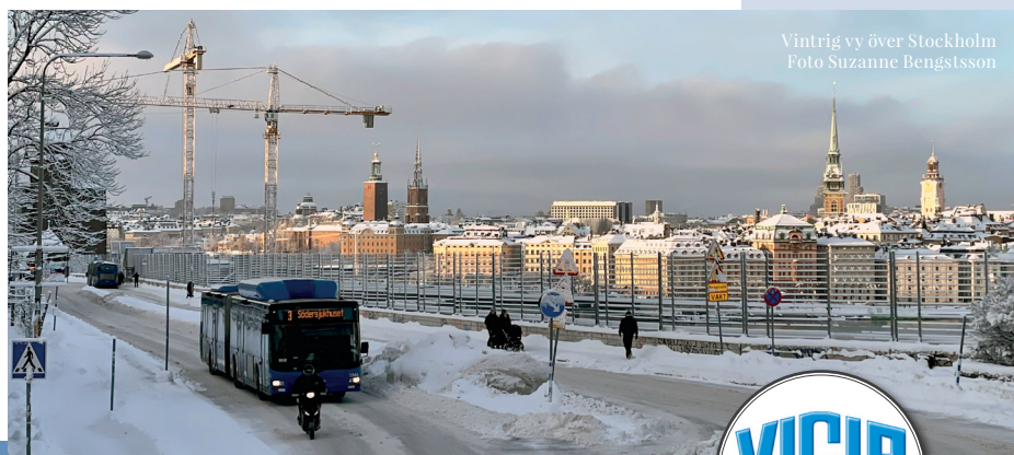
Vintrig vy över Stockholm