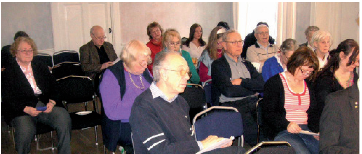
Deltagare på förbundsmötet 25 mars.