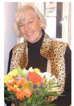
Gun Jareblad Ledamot (FP) i landstingsgruppen men har också ett förflutet som ordförande i VISIR Motala.

Motala kommuns folkhälso rapport, som togs fram under år 2010 av dåvarande styrelse, ska nu ligga till grund för vidareutveckling av folkhälsoarbetet i vår kommun. Ett