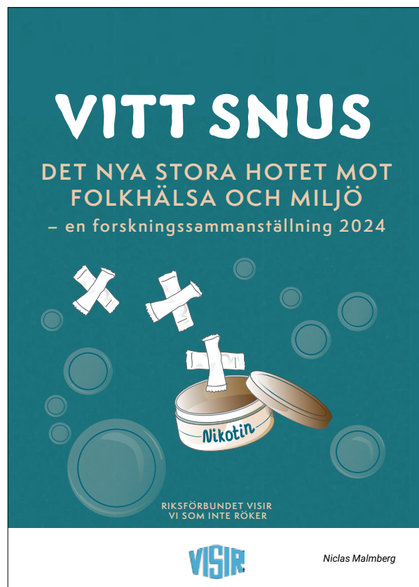
VISIR's rapport om det vita snuset

Genom att vitt snus klassats som tobaksfritt slipper det tobaksskatt, och har därmed blivit mycket billigare i konsumentledet. Vitt snus är i stället år 2024 belagt med en nikotinskatt om 202 kr/kg, det vill säga långt mindre än hälften av den tobaksskatt på 526 kr/kg som gäller för traditionellt snus. Från tandvården vittnar man redan om att