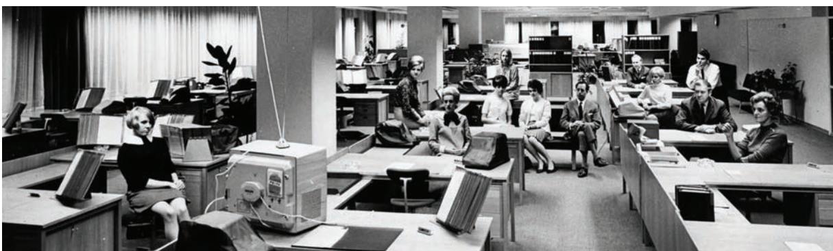
Kontorsmiljö Sundbyberg 1967.