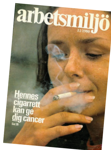
Arnes larmartikel i tidningen Arbetsmiljö 1980