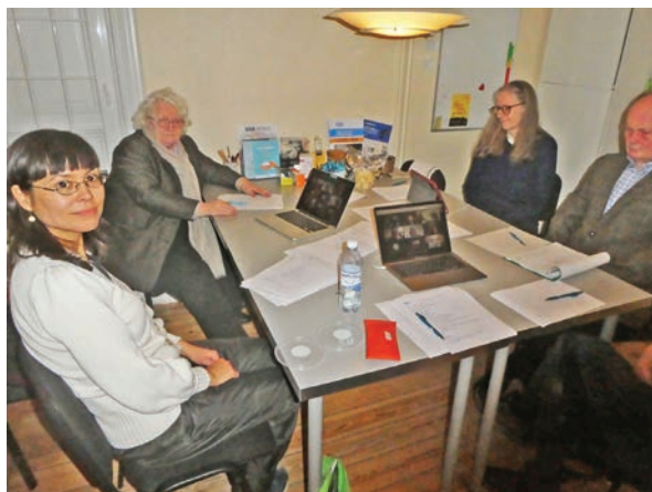
Samling på kansliet med datorer vid VISIRs digitala förbundsmöte.